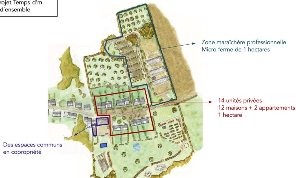
Illustration 2 : vue d'ensemble du projet Temps d'M qui est composé de 14 unités d'habitation, de bâtiments communs et d'un terrain commun de 3,5 ha dont 92 ares sont dédiés à la coopérative agricole via un contrat de bail à ferme avec clause environnementale.