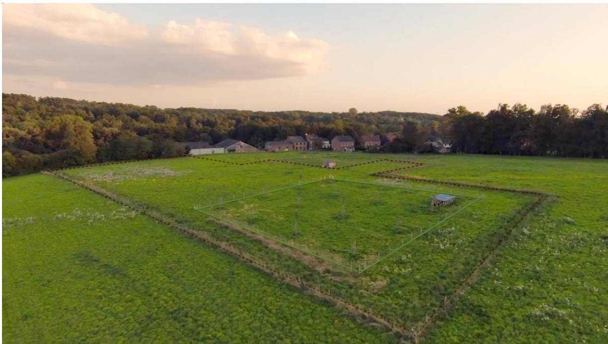
Illustration 1 : vue aérienne de la zone maraîchère (en rouge) de 92 ares incluant le petit verger hautes tiges de 13 ares (en vert).

Une coopérative agricole est en cours de création pour accompagner le lancement de l’activité agricole dans des conditions très avantageuses et innovantes. En effet, la coopérative fera les investissements de base nécessaires en infrastructures et mettra à disposition la terre gratuitement. De plus, un salaire rémunérateur sera garanti dès la 1ère année de production pour 1 ETP.